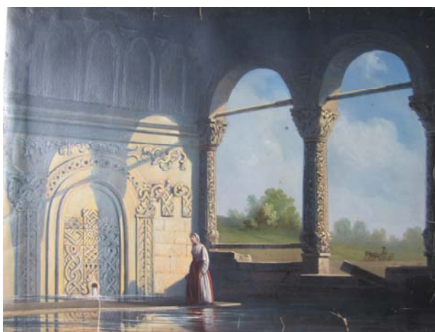
Fig. 3 – Henri Trenk – la fontaine publique de Filaret.

En un mot, on doit s'imaginer la ville phanariote de Bucarest tel un royaume des eaux, telle une Venise sui generis , où l'élément aquatique était tout à la fois l'ami et l'ennemi des habitants. Depuis le début du XIX e siècle « tout le monde boit de ce petit ruisseau (nn Dâmbovița), qui a une bonne eau », nous rassure Minas Băjășkian, un voyageur arménien qui a visité les principautés à deux reprises, en 1808 et en 1820 ( Călători , XIX, I, 2004, 465), citant à son tour le vieil adage « Dâmbovița apă dulce cin' te bea nu se mai duce » (« ô, Dâmbovița eau douce, celui qui se désaltère de ton eau, ne te quittera pas »), transcrit pour la première fois en 1785 par son compatriote Hugas Ingigian, qui l'avait par soi-même entendu souvent « de la bouche du peuple ». Si grande était la force de la tradition et de la commodité, que personne ne se souciait plus du fait que, entre temps, la rivière s'était remplie de toutes sortes d'immondices. Qui plus est, les Bucarestois étaient prêts à payer pour cette eau « plate » que les porteurs d'eau (« sacagii ») (fig. 4) puisaient dans la rivière et charriaient tout autour de la ville dans de grands tonneaux qu'ils chargeaient habituellement sur des châssis primitifs à deux ou quatre roues. Et seulement lorsque son goût la rendait totalement invendable se daignaient-ils de la « battre » (c'est-à-dire de la purifier) avec de la pierre d'alun.