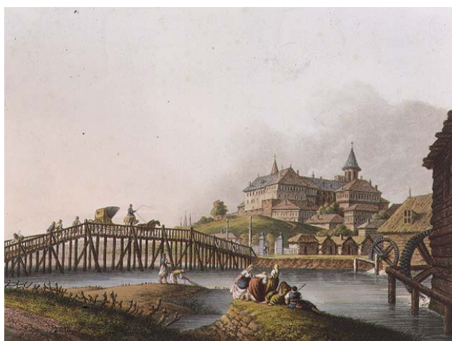
Fig. 5 – William Wats (d'après Luigi Mayer) – le couvent Mihai Vodă (Michel le Brave) de Bucarest, 1793 ; à droite des moulins d'eau sur le cours de la Dâmbovița.

En outre, comme nous l'avons déjà remarqué, l'eau des rivières et des lacs apportait une source supplémentaire de nourriture dans les menus des citadins et en même temps leur permettait d'arroser les potagers, les vergers ou les vignobles locaux. Et c'était toujours grâce à elle que l'on pouvait mettre en marche les moulins (fig. 5) qui servaient à moudre les grains, en arrondissant ainsi de façon non négligeable les revenus du seigneur, de la Métropole ou des divers Bucarestois dotés de l'esprit d'entreprise. D'ailleurs, au XVIII e siècle, la soif de gain a vu proliférer les moulins sur le cours de la Dâmbovița comme des champignons, sans prendre en compte les conséquences dévastatrices de leur exploitation irrationnelle sur la population locale. Car les barrages des moulins causaient des débordements, inondant d'entiers faubourgs, laissant sans abri bien des miséreux. Dépourvus de tout autre soutien, ils allaient porter plainte auprès du Hospodar, lequel, pour apaiser la foule, était parfois contraint à faire démolir le moulin qui avait causé l'ennui (« car la noyade et les dégâts qu'il a produits ont fait que Sa Seigneurie le fasse raser – nous raconte une ordonnance du prince du 25 novembre 1749) (Potra, 1961, 404). Parfois, en période de sécheresse, les moulins « volaient » presque toute l'eau aux habitants assoiffés, faisant même disparaître complètement la Dâmbovița, comme cela s'est passé en juin 1794 (Ionescu Gion 2008, 308).