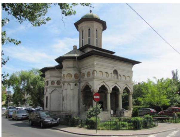
Fig. 1 – L'ancienne église Saint Eleuthère, située jadis dans un îlot de la Dâmbovița.