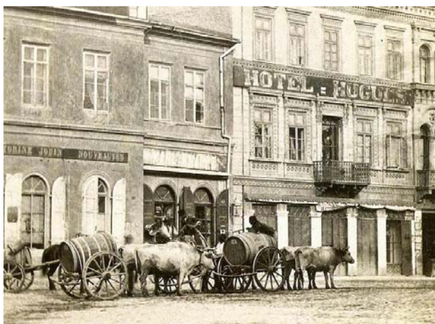
Fig. 4 – Moritz Benedict Baer – porteur d'eau à Bucarest.

En outre, comme nous l'avons déjà remarqué, l'eau des rivières et des lacs apportait une source supplémentaire de nourriture dans les menus des citadins et en même temps leur permettait d'arroser les potagers, les vergers ou les vignobles locaux. Et c'était toujours grâce à elle que l'on pouvait mettre en marche les moulins (fig. 5) qui servaient à moudre les grains, en arrondissant ainsi de façon non négligeable les revenus du seigneur, de la Métropole ou des divers Bucarestois dotés de l'esprit d'entreprise. D'ailleurs, au XVIII e siècle, la soif de gain a vu proliférer les moulins sur le cours de la Dâmbovița comme des champignons, sans prendre en compte les conséquences dévastatrices de leur exploitation irrationnelle sur la population locale. Car les barrages des moulins causaient des débordements, inondant d'entiers faubourgs, laissant sans abri bien des miséreux. Dépourvus de tout autre soutien, ils allaient porter plainte auprès du Hospodar, lequel, pour apaiser la foule, était parfois contraint à faire démolir le moulin qui avait causé l'ennui (« car la noyade et les dégâts qu'il a produits ont fait que Sa Seigneurie le fasse raser – nous raconte une ordonnance du prince du 25 novembre 1749) (Potra, 1961, 404). Parfois, en période de sécheresse, les moulins « volaient » presque toute l'eau aux habitants assoiffés, faisant même disparaître complètement la Dâmbovița, comme cela s'est passé en juin 1794 (Ionescu Gion 2008, 308).