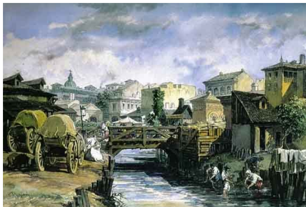
Fig. 2 – Amedeo Preziosi – pont sur le ruisseau Bucureștioara, 1869.

une attention particulière à l'embellissement des fontaines à eau courante; ils les enclosent de murs, ils leur donnent des noms célèbres aux quatre coins du monde et les parent de toutes les façons (fig. 3)» ( Călători , X, 1, 2000, 145).